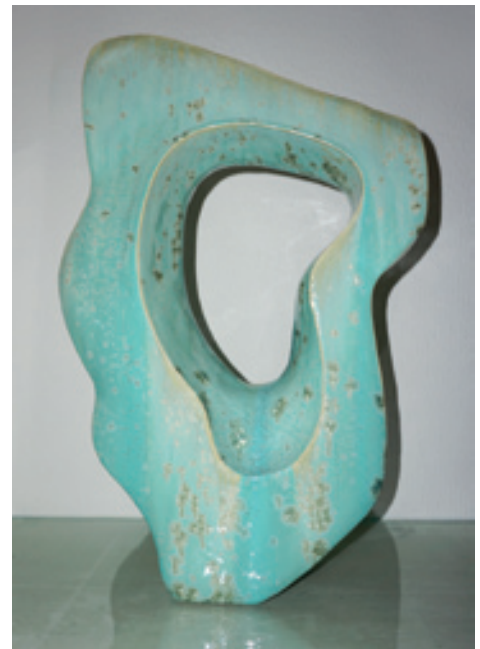
Gerdi Gutperle; Entwicklung ; Höhe: 70 cm, Keramik © Gerdi Gutperle

als positiv wirkend identifizierten Farben, subjektiv eine beachtliche Dominanz der positiven, für Licht und Helligkeit stehenden Farben erscheint. Geräuschlos fließen die Komplementärfarben in ruhigen Formen langsam ineinander, ohne Verschmelzung, jede ihre Farbe und Form wahrend, und doch scheint das ausdehnende Vorgehen vom „Guten“ beherrscht zu sein. Ein beruhigender Gedanke! Mit den großartigen – mal in lichthellen Smaragdfarben leuchtenden oder in schönsten Lapislazuli-Tönen klingenden – Skulpturen aus der Serie „Unknown“, die mit ihren natürlichen goldenen Akzenten und rätselhaften Konturen brillieren, entdecken wir eine ganz neue Formensprache Gerdi Gutperles. Es entstehen reizvoll organische Öffnungen, die – wie Zauberfenster aus Märchen – Blicke in „die anderen Welten“ ermöglichen. Allein die Vorstellung davon und das aktive „Hindurchsehen“ erweitern den Horizont und ermöglichen beschwingend kraftvolle Perspektivwechsel. Die Frage, ob diese neue Skulpturenserie trotz oder gerade wegen ihrer gebrochenen Geometrie von derart harmonischer Ausstrahlung und feinsinniger Wirkung