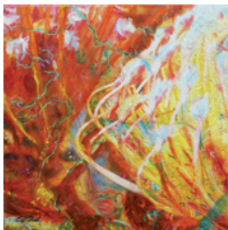
Gerdi Gutperle; Kraftvoll;

zusätzlich wird die frische Inszenierung des Lichtes mit dynamischer Bewegung unterstrichen. Ein wenig an Zugvögel erinnern die in rotvioletttem Farbklang angelegten Wesen in einem kompositorisch fein ausgearbeiteten mittleren Bereich: Sie scheinen in luftiger Höhe über Berges- und Meereslandschaften zu gleiten, ja die gesamte Welt in einem Bruchteil ewiger Zeit zu umrunden und je nach Blickmoment des Betrachters von links nach rechts oder umgekehrt. Ob es sich hierbei um eine bewusst platzierte kompositorische Raffinesse handelt oder um ein intuitives Sich-Ergeben, weiß die Künstlerin allein. Einer von vielen Gründen für den Besuch im musealen Kunstraum Gerdi Gutperle ist es, der facettenreich reizvollen Gesamtsymphonie der besonderen Werke auf den Grund zu gehen, ihr Licht zu