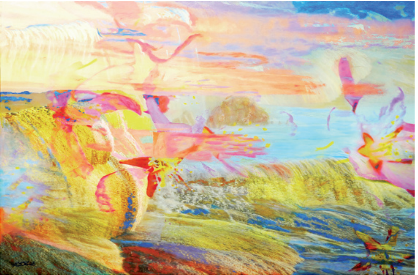
Gerdi Gutperle; Zauber der Natur; Mixed Media, 100 cm x 140 cm