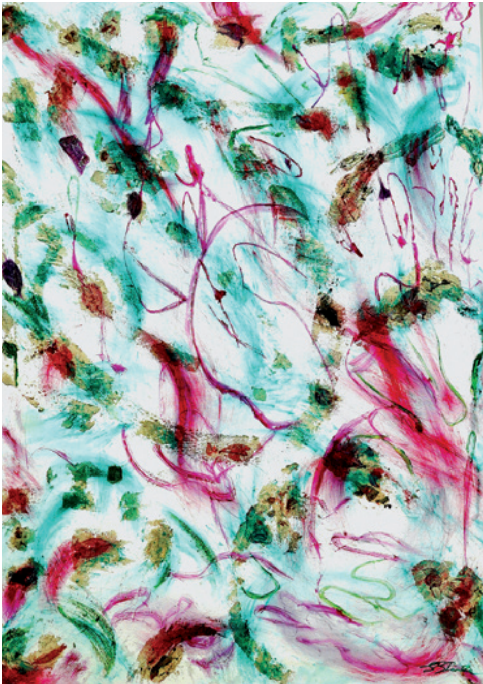
Gerdi Gutperle; Wachstum ; Mixed Media, 140 cm x 100 cm © Gerdi Gutperle

einst Johann Wolfgang von Goethe im Rahmen seines in Plus- und Minusseite eingeteilten Farbkreises. Laut Goethe gibt es nur zwei reine Farben: Gelb und Blau, die er diametral gegenüberstellt. Die Farbe Purpur führt das Spektrum an, da sie nicht aus anderen Farben mischbar ist. Die Farbtöne Gelb, Gelbrot bis Rot bilden den Plusanteil, die gelben Klänge