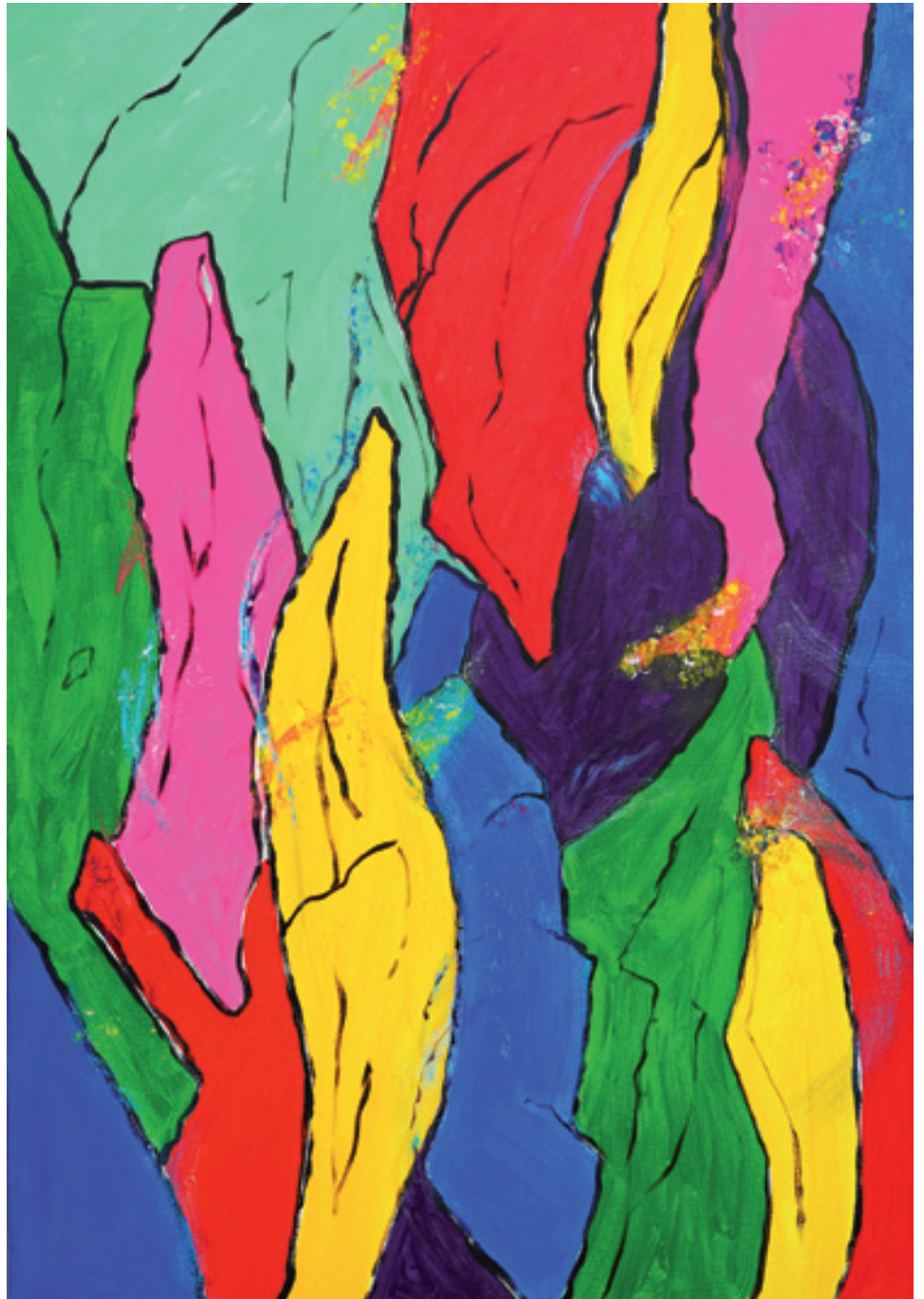
Gerdi Gutperle; Farb und Form; Mixed Media, 100 cm x 70 cm © Gerdi Gutperle

scheint gerade in besonders herausfordernden Situationen die Investition in Kunst eine in vielerlei Hinsicht kluge Entscheidung zu sein. Eine geheime und helle Macht, die ausschließlich Gutes bewirkt, können wir doch zweifelsohne gerade alle brauchen, oder? Werfen Sie einen Blick auf das Back Cover dieser Ausgabe und tauchen Sie ein in die heilsamen Kräfte und