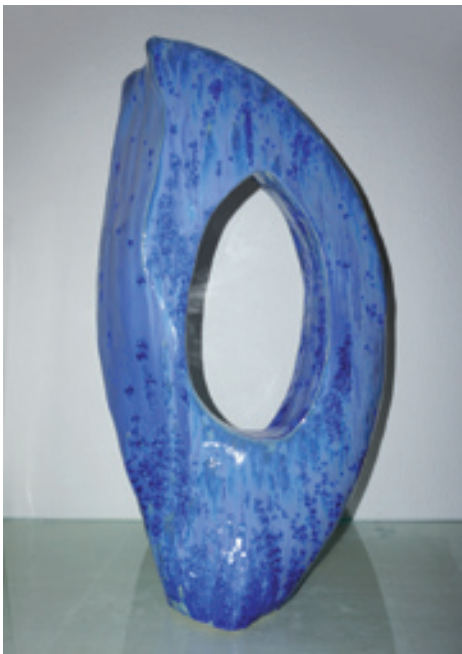
Gerdi Gutperle; Kraftvoll; Höhe: 63 cm, Keramik © Gerdi Gutperle

ist, bleibt schwer zu beantworten. In jedem Fall strahlen die Skulpturen Gerdi Gutperles feinfühlig erfindungsreichen Esprit aus, der gerade als Kunst im Unternehmen inszeniert eine unbezahlbare Wirkung auf Energie, Kreativität und Wohlbefinden der Mitarbeitenden, Gäste und Geschäftspartner zu haben vermag. Kunst steigert das Wohlbefinden in allen Lebenssituationen und vermag insbesondere die Bedeutung empfundener Sinnhaftigkeit zu erhöhen – so das Fazit einer im Frühjahr 2025 veröffentlichten internationalen Studie, die im Rahmen des ART*IS-Forschungsauftrags durchgeführt wurde, unter Beteiligung der Humboldt-Universität Berlin, der Universität Wien und der Radboud-Universität Nijmegen, publiziert im „Journal of Positive Psychology“ als Methode zur Förderung von Resilienz, psychischer Gesundheit und Optimismus. Insofern